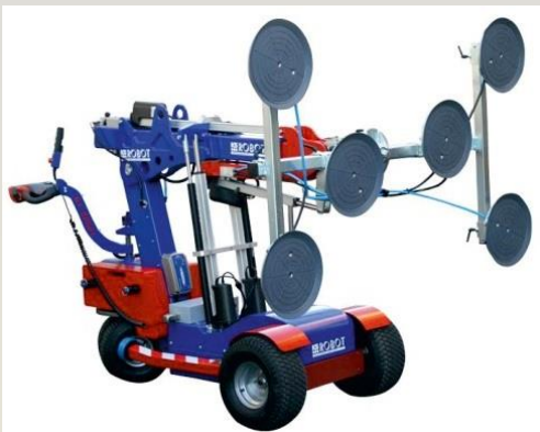
Príslušenství místo sacích talířů: